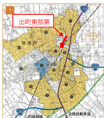
「区画整理によるまちづくり 富山県 H28.10 発行」を使用